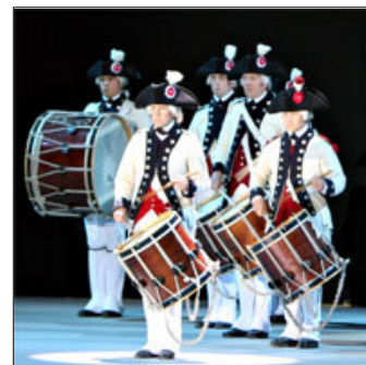
...oder gar aus Übersee: «Middlesex County Volunteers» aus Boston.