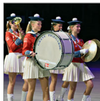
...oder aus dem Norden wie die Girls Band «Greve Pige garde» aus Dänemark